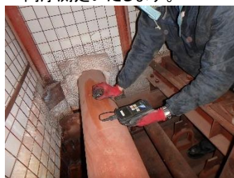
配管の肉厚測定状況